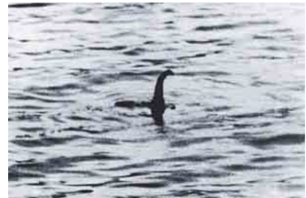
Знаменитая поддельная фотография доктора Уилсона