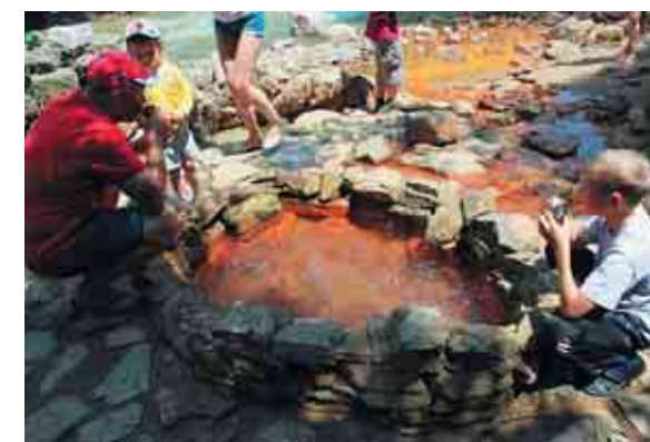
Бассейн с природной минеральной водой в Долине Нарзанов

Кто-то из вас наверняка бывал в таких городах, как Пятигорск, Кисловодск или Ессентуки; в этих краях самая настоящая газированная минеральная вода бьёт прямо из-под земли, достаточно протянуть руку и наполнить кружку! Немного южнее Кисловодска есть место, которое и