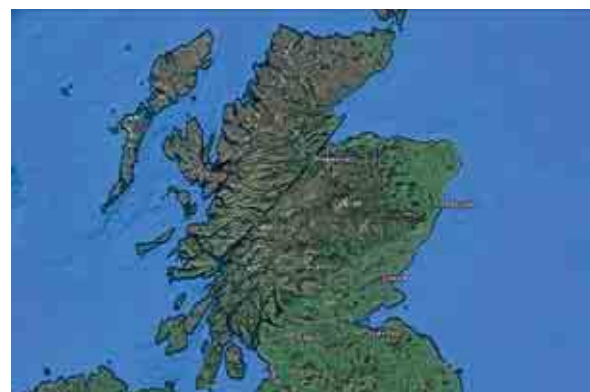
Вид на разлом Глэнмор из космоса

Места эти очень красивы. Среди поросших лесом гор расположена цепочка из узких (порядка двух километров), но очень длинных (общая длина около 100 километров) озёр: Лох-Линне, Лох-Лохи, Лох-