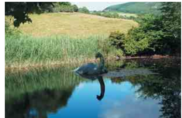
А если так?

Лох-Несс вдоль и поперёк, но никакого монстра так и не обнаружили. А врач Уилсон, автор самой знаменитой фотографии Несси, в конце концов признался в том, что снимок – обычная подделка.