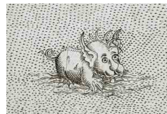
Загадочные водные обитатели на старинных гравюрах

ложить, что при его огромных размерах он питался одной лишь речной рыбой, достаточно трудно.