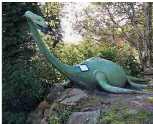
Добро пожаловать в Нессиленд!

Или не просто выдумки? Ведь поддельная фотография Уилсона появилась не случайно! Истории про загадочного «водяного зверя» в реке Несс и озере Лох-Несс известны очень давно, ещё начиная с ирландских хроник 6-го века