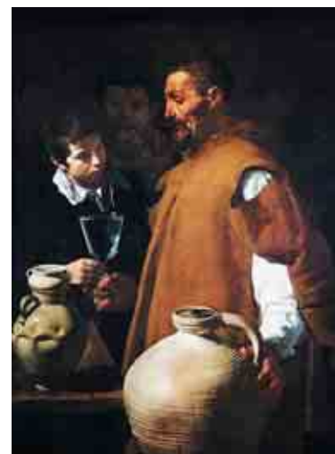
Диего Веласкес. «Продавец воды в Севилье»

В Средние века в Испании пресная вода из горных источников